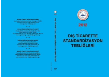
Dİř Ticarete Standardizasyon Tebliđleri